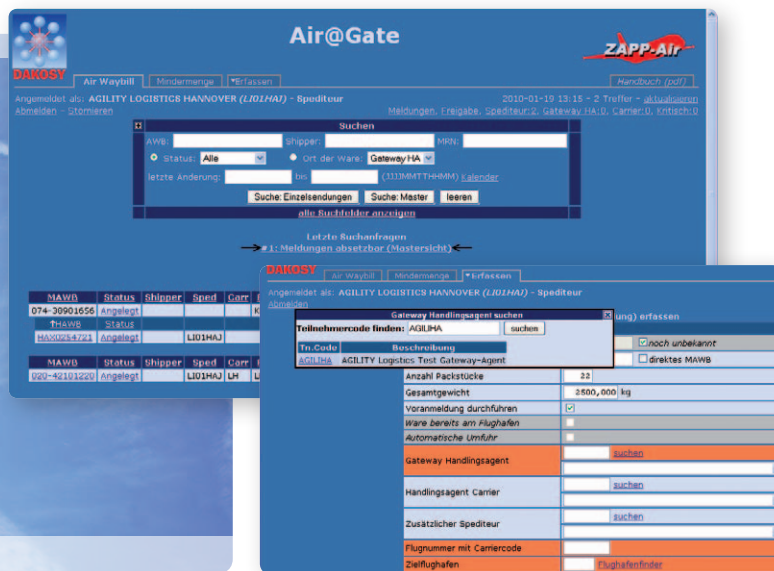
Alle zollrelevanten Daten für ATLAS-AES auf nur einer Bildschirmmaske vereint

Nachdem das abgewinkelte Transaktionsvolumen bereits in den ersten Monaten überproportional angestiegen war, hat sich Agility für eine EDI-Schnittstelle von ZAPP-Air zum eigenen Speditionssystem entschieden, die seit Februar 2010 in Betrieb ist.