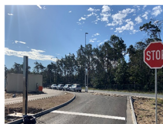
Swissport Cargo Services Deutschland GmbH, Gebäude 544, Cargo City Süd, 60549 Frankfurt/Main

Booking Confirmation at SCS SLOT START: 02.10.20 12:15 PIN: XXXXXXXXXX DOOR: Rampe 1 Please arrive on time, or slot will expire. Swissport Cargo Services